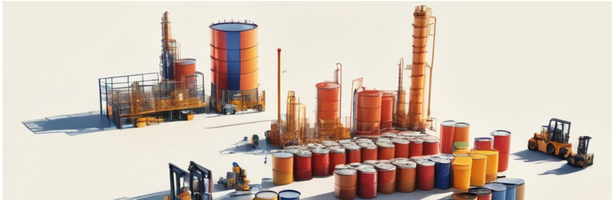
Evolución Mensual hasta junio 2024